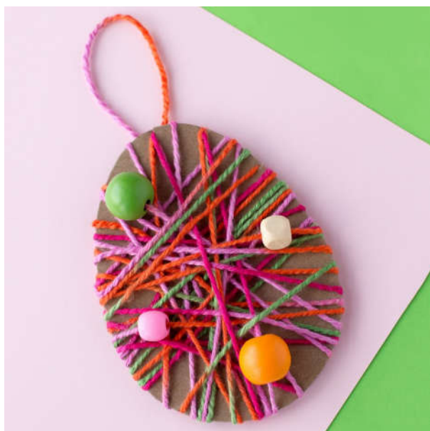
Η τελική κατασκευή

Φτιάξε χάρτινο αυγό δεμένο με μαλλί. Οι εικόνες θα σε καθοδηγήσουν!