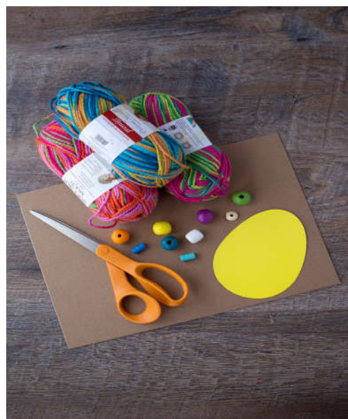
Τα υλικά που θα χρειαστείς